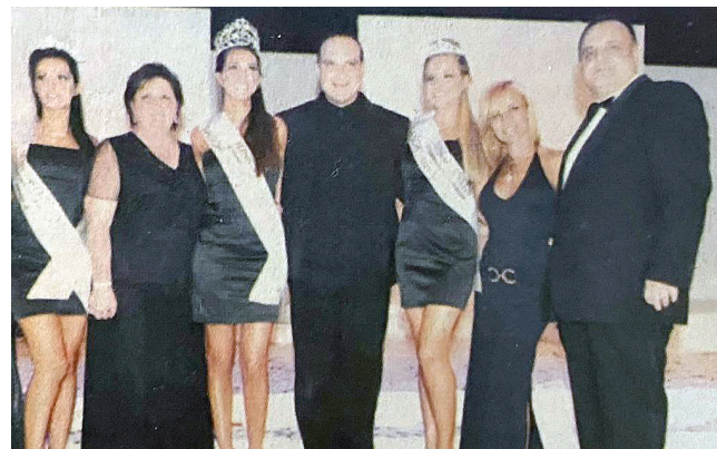
Miss Italia nel Mondo Sud Africa