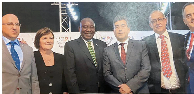
HIP Alliance e il Presidente C. Ramaphosa