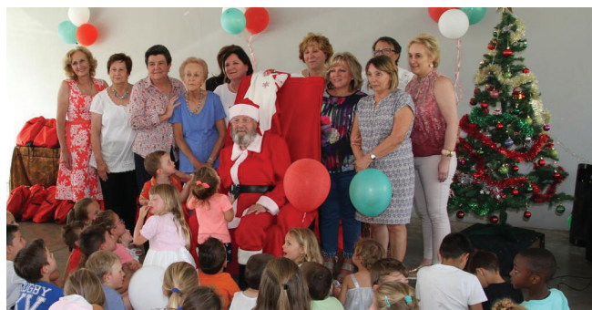
JILS, Festa di Natale